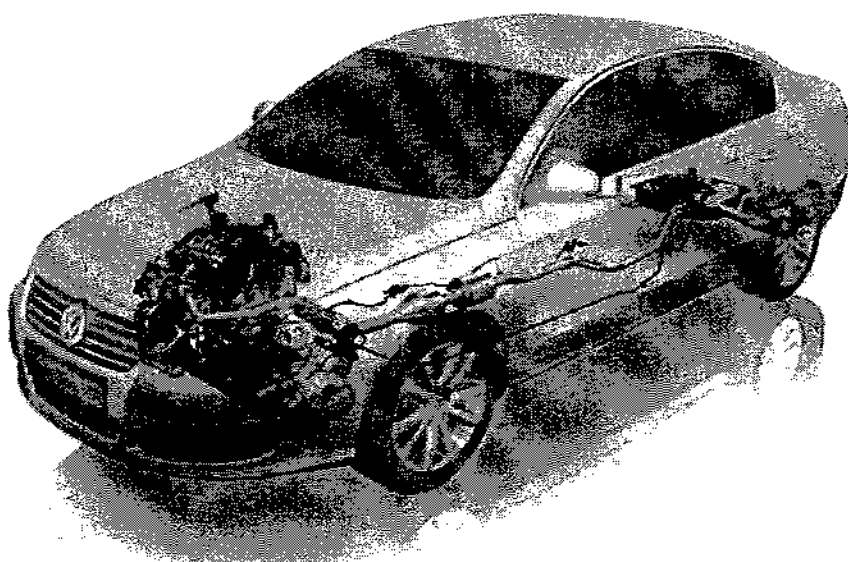
Rozmieszczenie elementów systemu redukującego tlenki azotu NOx w nadwoziu

Opisany sposób uzupełnienia wyposażenia samochodu pozwala na utrzymanie parametrów trakcyjno-eksploatacyjnych pojazdu (zużycie paliwa i moment obrotowy silnika) przy jednoczesnym spełnieniu norm dotyczących norm toksyczności spalin.